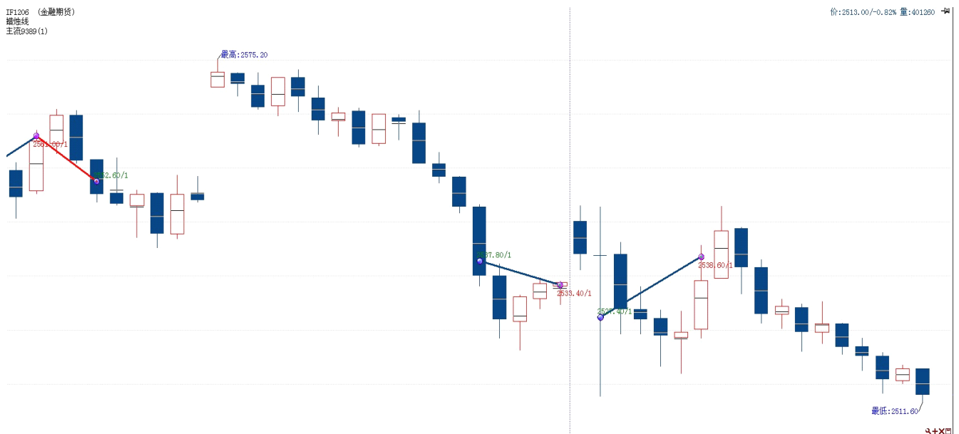
图表 2: 交易情况