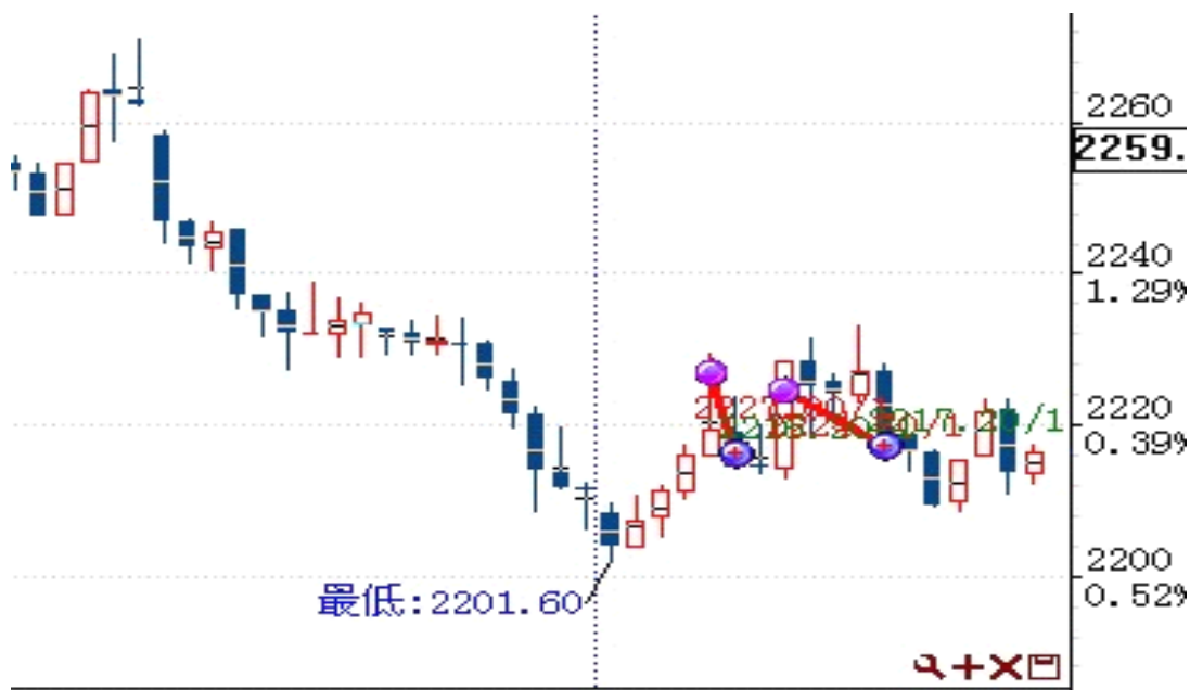
图表 1: 交易痕迹