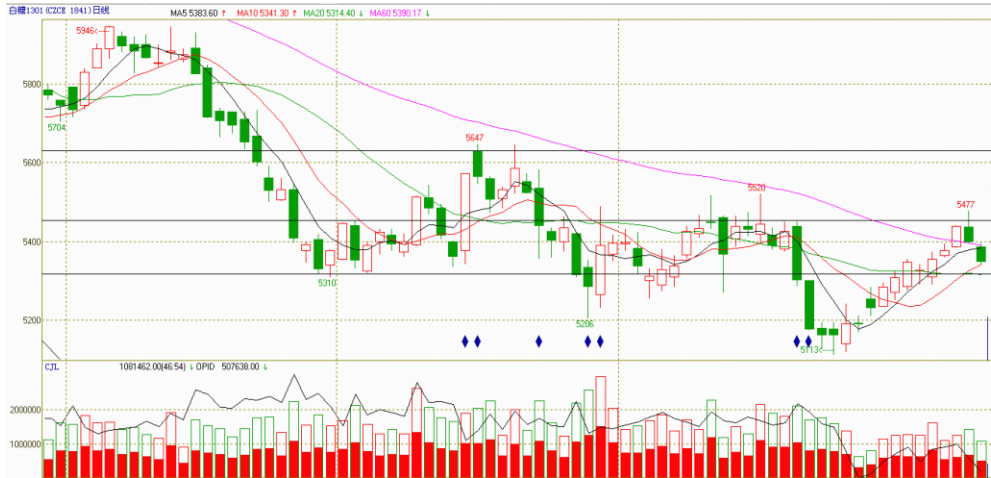
图 1 郑糖 1301 合约日线周期反弹遭破坏