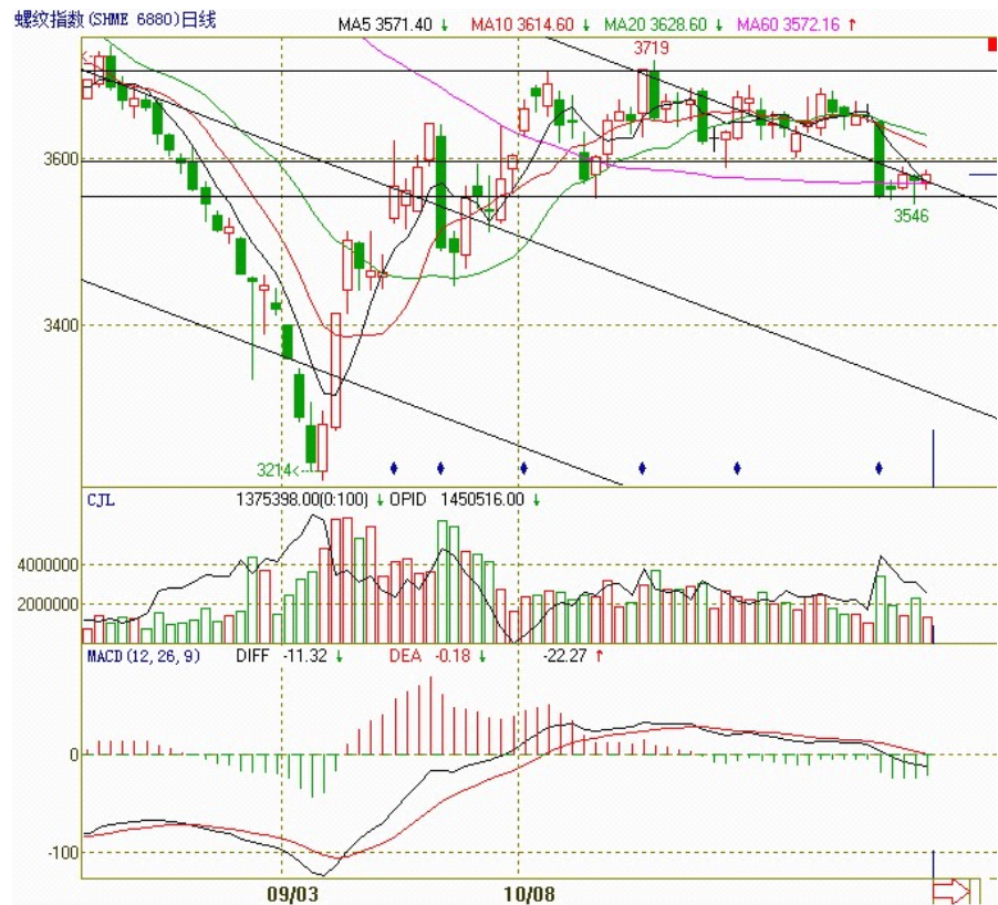
图一：螺纹指数日线图

本周螺纹指数打破10月份以来的震荡态势，整周呈现破位下跌之势，较之上周，期价的重心小幅下移，跌破中短期均线，目前“银十”已过，市场需求释放有限，随着寒冷天气的到来，后市期价上行空间非常有限，技术面二话，预计下周期价延续偏弱的可能性大。