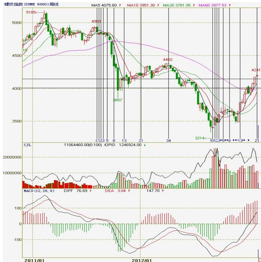
图二：螺纹指数周K线图

间，两条边形成上升三角形形态，节前一周期价在前期震荡密集区上沿获得支撑，整周呈现探底回升态势，依然运行于上升三角形中，后市建议投资者关注期价的妥防线，短期内期价呈现高位震荡的可能性大，建议前期多单警惕高位回落风险，注意保护盈利。