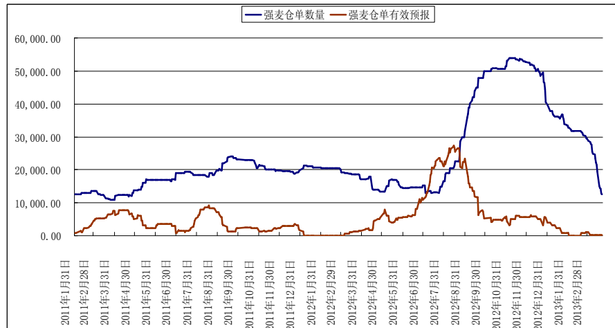
图3 强麦仓单及仓单有效预报

强麦方面，本周仓单继续减少，两周数量缩减一半。截止3月22日，强筋小麦的仓单数量为12561张，较上周五大幅减少6786张；有效预报数量150张，保持不变。