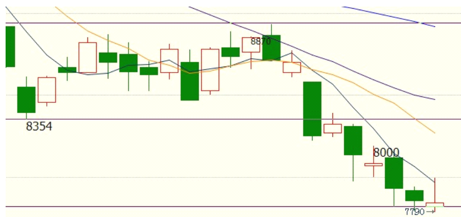
连豆油 9 月合约周线箱体破位寻底

技术说明：7800 是为短期箱体下破目标，关注短期支撑，有效下破方可追空，否则不杀跌，易陷入震荡。