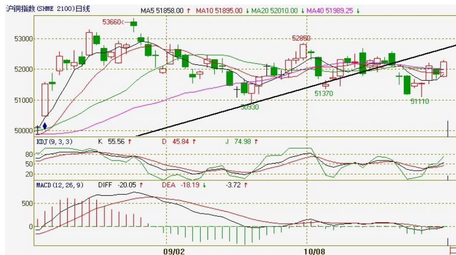
沪铜指数日 K 线图

技术上看，伦铜继续在 20 周线和 40 周线之间波动，且跟随均线的下行重心下移，沪铜仍在宽幅震荡区间之内，本周小幅收涨，周中的下跌止步 20 周线，后市或维持区间波动；日线级别上，本周伦铜探低回升报收在常用均线之上，沪铜 51500 失而复得，但全周仍运行于上升趋势线之下，均线形态逐渐粘合，下周有望继续围绕 51500 波动