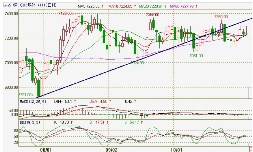
伦铜电3日 K 线图