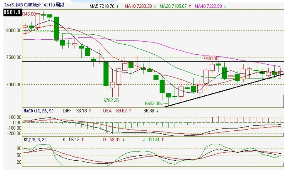
伦铜电3周 K 线图