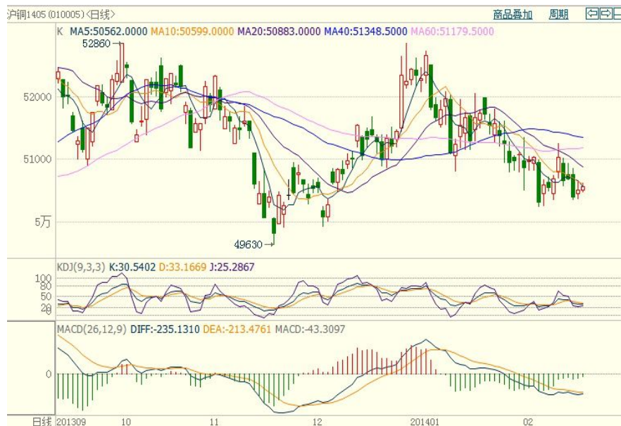
沪铜主力1405合约日K线图

本周期铜冲高回落。伦铜重心小幅上移，上方承压于10周均线，最终收平；沪铜仍在前几周运行区间之内波动，主力1405合约全周落入50300-51300之内，多空双方在日短期均线处反复争夺，技术指标维持弱势。