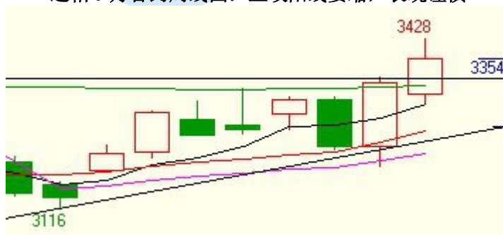
连粕 9 月合约周线图：上攻阳线萎缩，表现谨慎

技术说明：长上影周线，暗示 3400 之上存在短线压力，3350 可视为多空分水岭，主要节奏。