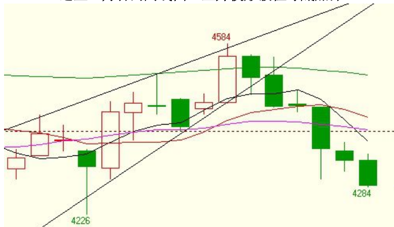
连豆 9 月合约周线图：上升楔形破位寻底加深