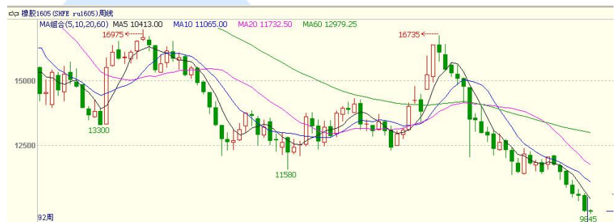
图 3 RU1605 合约周线图

1605 合约月 K 线报收六连阴，本月跌幅有扩大之势，中线跌势不改；本周期价中阴跌破万点支撑，周线级别亦报收六连阴；日线全周在 5 日均线的压制下持续下行，均线系统向下扩散，日线级别呈现明显的空头走势。