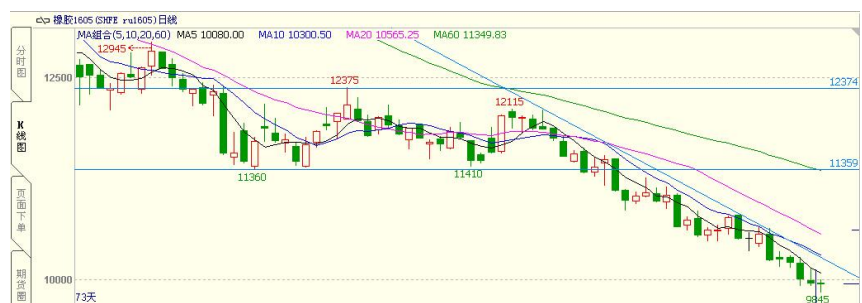
图 4 RU1605 合约日线图