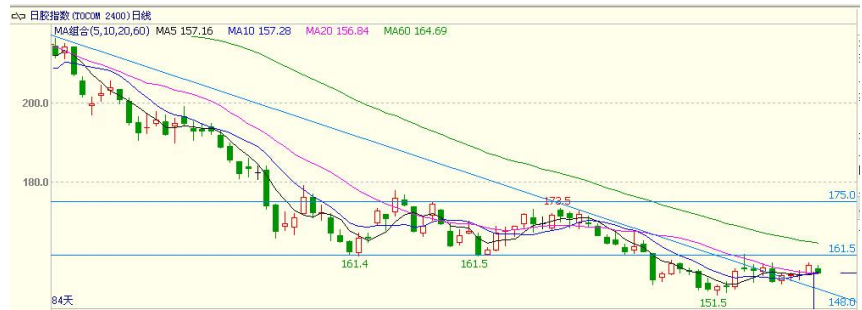
图 5 日胶指数日线图

日胶指数相对抗跌，本周期价重心缓慢上移，但若未能有效突破前期震荡区间下沿 161.5 一线压力，整体弱势震荡格局难改。