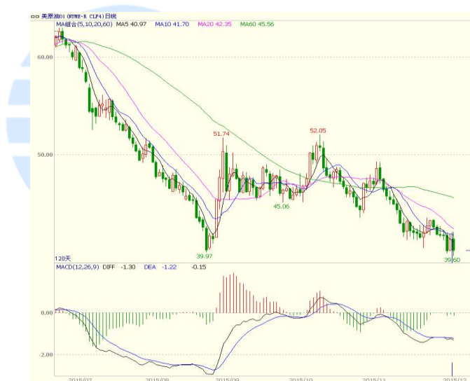
图 1 美原油主力合约价格走势

本周美国能源信息署数据显示，截止 11 月 27 日当周，美国商业原油库存量 4.8942 亿桶，比前一周增长 118 万桶，连续十周增加；库欣地区原油库存增加 42.8 万桶。石油服务提供商贝克休斯发布的报告显示，美国本周活跃石油钻井平台数量较上周下降 10 座，至 545 座，过去 14 周内 13 周减少，为 2010 年 6 月以来最低。本周 OPEC 在会议之后宣布就不减产达成共识，但因伊朗重返市场，无法就具体数据达成一致。OPEC 在会议声明中未提及任何产量目标。目前欧佩克实际原油日产量约为 3 1 5 0 万桶，连续多个月超过该组织确定的日产量 3 0 0 0 万桶的限额。至收盘美原油周 K 线收盘下跌 3.90%，收出中阴线，总体走势仍偏弱。