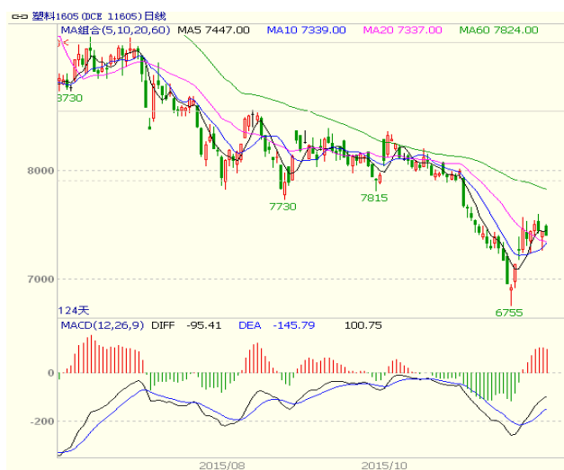
图 3 LLDPE1605 合约日线图

显示上有压力，下有支撑。日线上，塑料走势围绕 5 日均线震荡，下方 10、20 日均线有一定支撑。而周线、月线上方 10 周期均线承压，短线走势震荡。