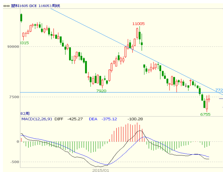
图 4 LLDPE1605 合约周线图

在前期跌破 7730-8550 的箱体下沿后，上周收出底部阳吞阴组合，反弹意愿强烈，但中期看上方压力仍大，本周冲高后回落。