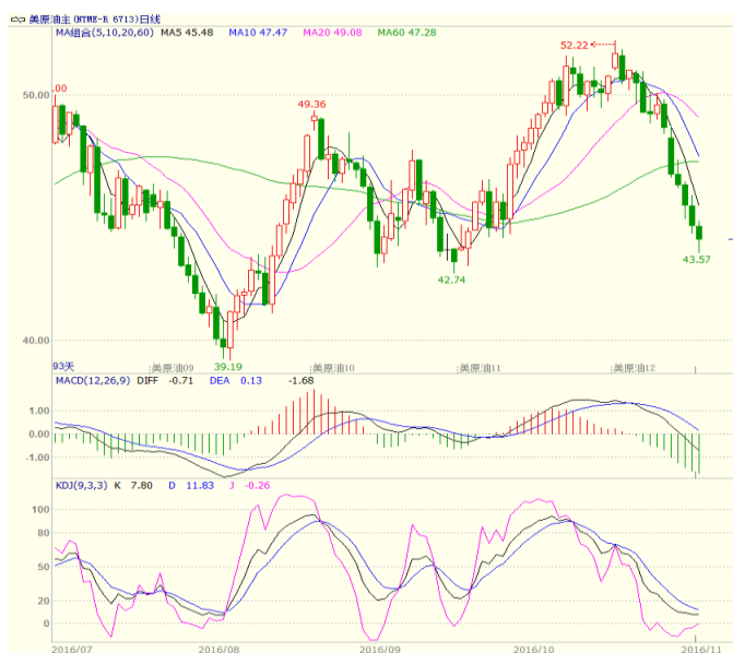
图1 美原油主力合约周线图

本周美国能源信息署(EIA)公布的数据显示,截至11月4日当周,美国EIA原油库存增加243.2万桶,至4.85亿桶;库欣地区原油库存5848万桶,增加了2.8万桶。美国油服贝克休斯公布的数据显示,截至2016年11月04日当周美国石油活跃钻井数增加2座至452座,延续了近期的连续升势,过去24周内,有21周录得上升。近期,市场对欧佩克能否真正执行限产的担忧增加,同时,由于特朗普当选美国总统,其希望美国能够完全实现能源独立,并主张取消在联邦土地开采石油的限制,使得油价承压。至收盘美原油周K线收盘下跌2.29%,收出带长上影阴线,上方5、10周均线承压,短线震荡偏弱走势。