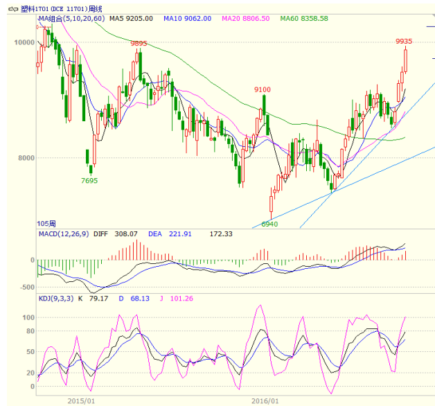
图 4 LLDPE1701 合约周线图