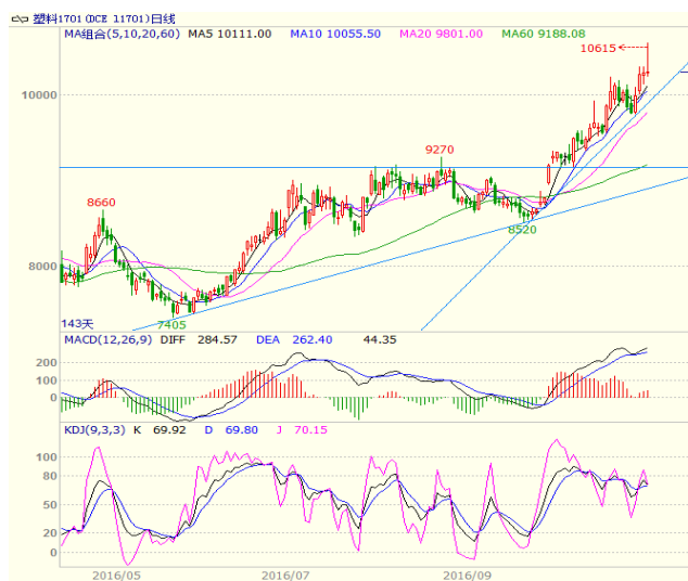
图 3 LLDPE1701 合约日线图

有一定压力。周一收出带长上影阴线、周二收出中阳线、周三高开高走收出中阳线，周四走势震荡收出小阳线，周五冲高回落收出带长上影的十字线。最终周线带长上影的中阳线。均线方面，下方 10、20 日均线形成支撑，周线上，5、10、20 周均线多头排列，且本周继续向上，下方 5 周均线处支撑较强。