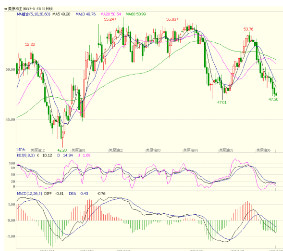
图1 美原油主力合约日线图

本周美国能源信息署(EIA)公布的数据显示,截至4月28日当周EIA原油库存减少93万桶,低于预期的减少291.4万桶;汽油库存汽油下降20万桶预期增加100万桶。库欣原油库存减少72.8万桶,市场预期减少90万桶。美国国内原油产量增加12.8万桶至929.3万桶/日,连续11周增加且继续维持在900万桶/日关口上方。上周贝克休斯公布数据显示,截至4月28日当周,美国石油活跃钻井数增加9座至697座,连续15周录得增加,创2015年4月以来最高。原油较周初走低,预计短线运行区间46.5-49.5。