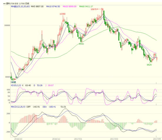
图 3 LLDPE1709 合约日线图