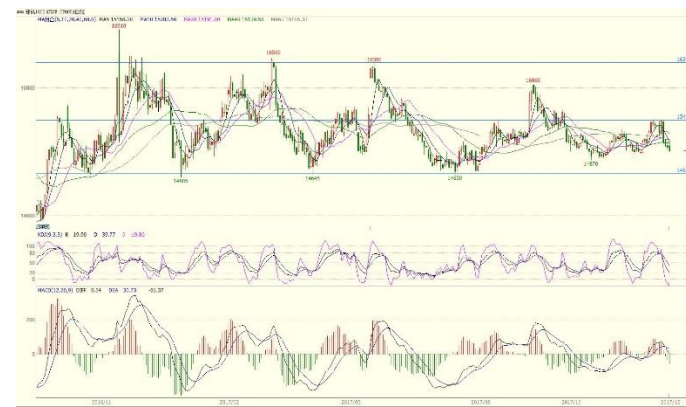
图 2. CF1801 日线图