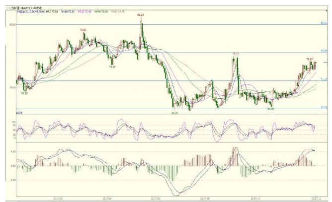
图 3. ICE 期棉指数日线图