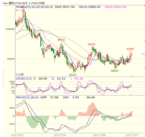
图 3 LLDPE1709 合约日线图