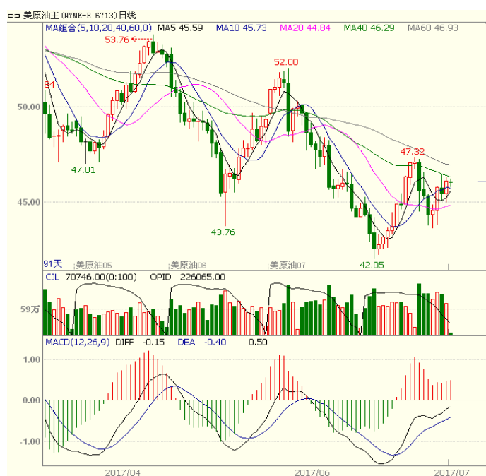
图1 美原油主力合约

本周美国能源信息署(EIA)公布的数据显示,截至7月7日当周原油库存减少756.4万桶,前值为减少629.9万桶,预期为减少245.0万桶,美原油库存为10个月来的最大周度降幅。库欣地区原油库存减少194.8万桶,前值减少133.4万桶。IEA月报将2017年原油需求预测上调10万桶/日,同时预计明年的原油需求将以“类似速度”增长。原油较周初走高,预计短线运行区间43.6-47.9。