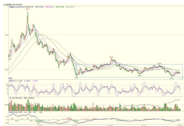
图 4. 日胶指数日线图