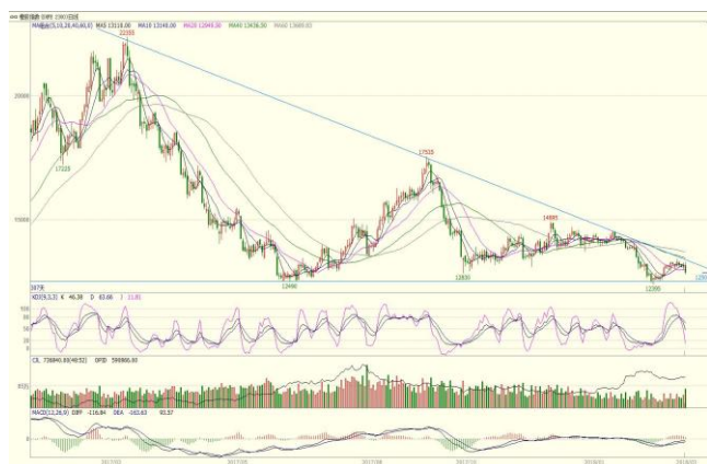
图 3. 沪胶指数日线图

从日胶指数日 K 线图上看, 期价整体依旧运行于去年 6 月以来的低位震荡区间, 短线仍见延续震荡整理走势。