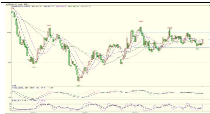
图 5. L1809 日 K 线图