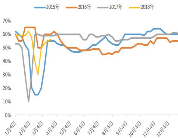
图 2.包装膜开工率（单位：%）