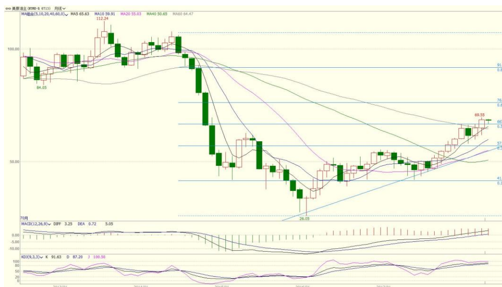
图 3.WTI 原油主力月 K 线（单位：美元/桶）

近期地缘政策担忧主导原油市场，WTI 期价逼近 70 美元/桶整数关口。美国总统特朗普将对伊核协议最终立场的截止时间设定在 5 月 12 日，如果欧盟拿不出让特朗普满意的修改方案，美国将退出伊核协议。伊朗是全球第五大、OPEC 第三大产油国，目前出口量达 220 万桶/日左右。如果美国退出伊核协议或者对伊朗重新施加制裁，势必影响伊朗原油供应，近期国际原油价格高位偏强运行，从成本端给化工品带来较强的支撑作用。