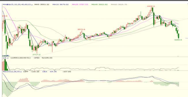
图 4. 上证指数周 K 线图