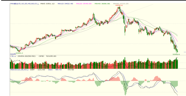
图 6.上证指数日 K 线图