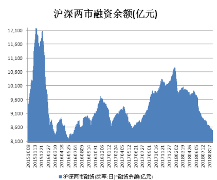
图 2. 沪深两市融资余额变化