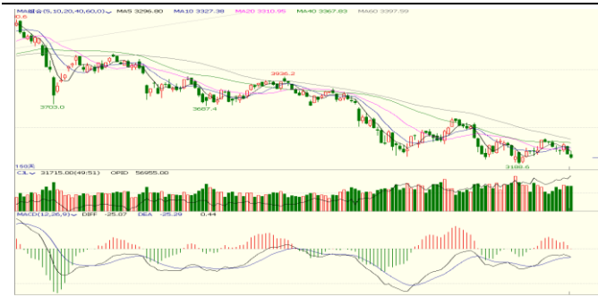
图 6.上证指数日 K 线图