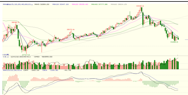
图 4. 上证指数周 K 线图