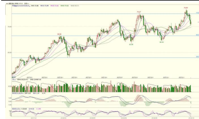
图 2. WTI 主力日 K 线图