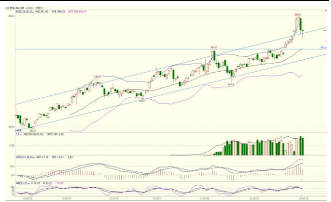
图 3. SC1812 日 K 线图