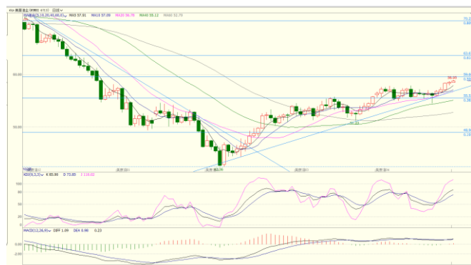
图 4. WTI 主力日 K 线图

从 PP1905 日 K 线图来看，期价冲高回落，若区间下沿 8600 支撑无效，短线回调目标将指向 8200。