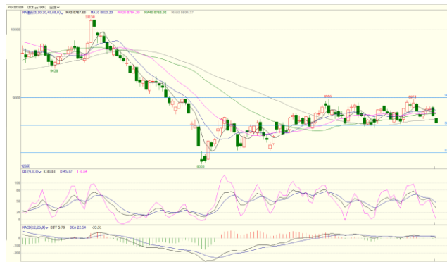
图 5. PP1905 日 K 线图