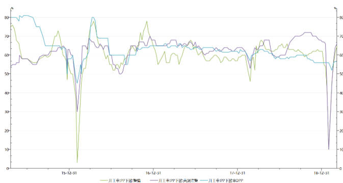
图3. PP 基差 (单位：元/吨)