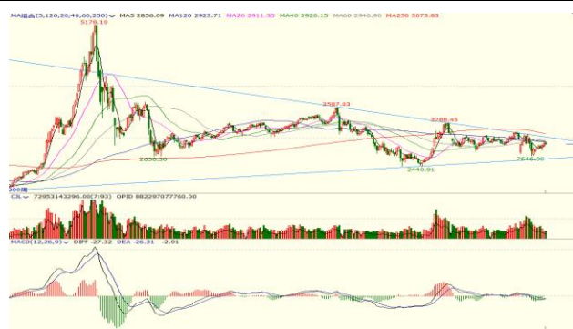
图 4.上证指数周 K 线图