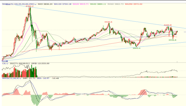
图 3.IF 加权周 K 线图

周线方面，IF 加权在 20 周线附近遇阻回落，跌破 40 周线，连续反弹后存在回调的要求。年初新冠肺炎疫情打乱了股指原来的运行节奏，但很快得到修复，股指中期反弹思路不改。