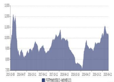
图2. 沪深两市融资余额变化