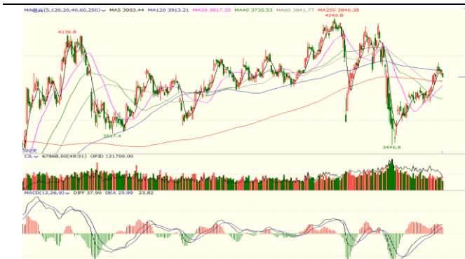
图 6. 上证指数日 K 线图